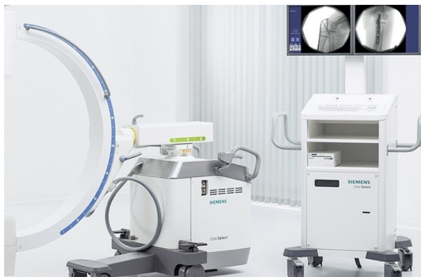
Arco a C

Strumento polifunzionale, già donato nel 2018, che consente interventi non invasivi per Radiologia interventistica, Chirurgia vascolare, Terapia del dolore e altri impieghi.